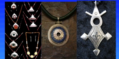
Χειροποίητα χρυσαφικά αντικείμενα της φυλής τους